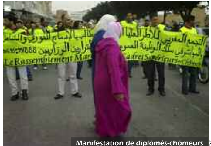
Manifestation de diplômés-chômeurs

garantir un emploi et réclament le droit à un poste dans la fonction publique afin de ne pas subir la précarité du secteur privé. Lors des manifestations, ils scandent des slogans comme « La fonction publique ou la mort ! ». Ces revendications sont jugées par certains trop radicales dans la mesure où la fonction publique n'a pas pour vocation d'embaucher tous les diplômés marocains.