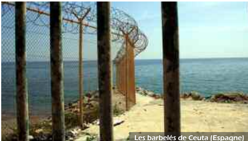
Les barbelés de Ceuta (Espagne)

C'est le groupe du laboratoire Migrinter à l'Université de Poitiers qui, le premier, a théorisé autour de la notion de « circulation migratoire ». Les politiques l'ont repris à leur compte et l'ont redéfini à travers le terme de « migration circulaire ». Celui-ci évoque pour nous une politique de régulation des flux migratoires, de contrôle des frontières, d'immigration choisie, utilitariste, marquée par des inégalités entre le Nord et le Sud, servant à garantir les besoins économiques des pays du Nord (UE, Etats-Unis, Canada, etc.) grâce aux pays du Sud, tout en se donnant bonne conscience.