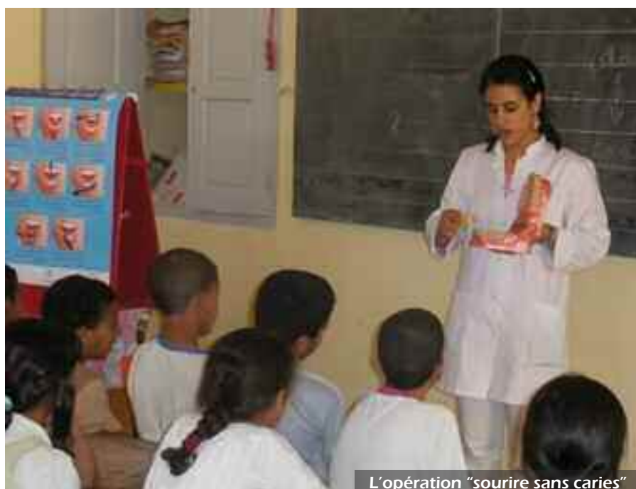
L'opération "sourire sans caries"